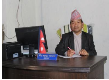
विर बहादुर लोष्वन गाउँपालिका उपाध्यक्ष